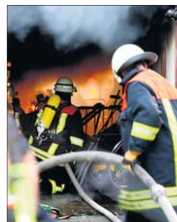
Die Männer der Feuerwehr Harksheide im Einsatz.