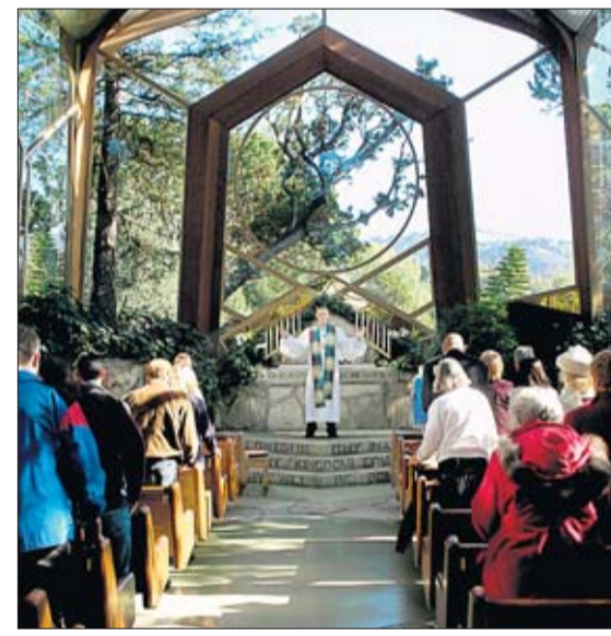
Gottesdienst in der „Wayfarers Chapel“ im kalifornischen Rancho Palos Verdes. Die Norderstedter Kirche könnte laut Pastor Gunnar Urbach ganz ohne eine Holzkonstruktion und komplett aus Glas gebaut werden.

Kosten soll das Gebäude maximal eine Million bis 1,2 Millionen Euro. Die hiesigen Kirchengemeinden sollen dafür nicht zur Kasse gebeten werden, und für die Stadt wird die gläserne Kirche „ein Geschenk“ (Urbach). Allerdings soll Norderstedt den Baugrund zur Verfügung stellen.