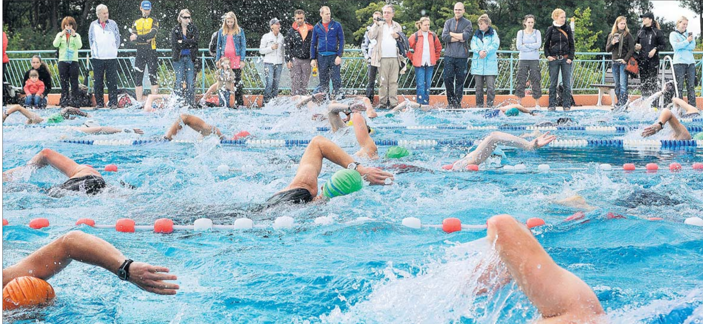
Start frei zum 3. TriBühne-Triathlon in Norderstedt. Im Außenbecken des Norderstedter Arriba-Bades gingen jeweils 48 Starter gleichzeitig ins Rennen.